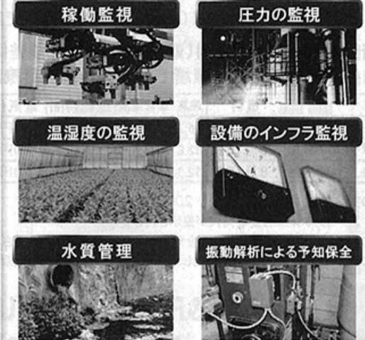
LANを通じて簡単に現場のデータ収集や変化を発信することができます。