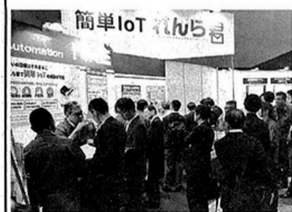
IOT/M2M展での展示の様相

IoT/M2M展に出品。これらパック商品の事例を展示、紹介した。会期中、製造業の来場者を中心に会場で多くの引き合いを得たという。